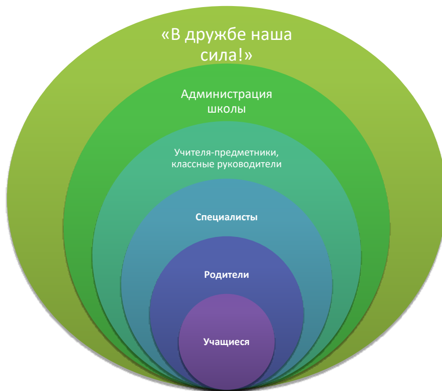
Схема управления программой

Для реализации программы «В дружбе наша сила!» созданы определенные условия: